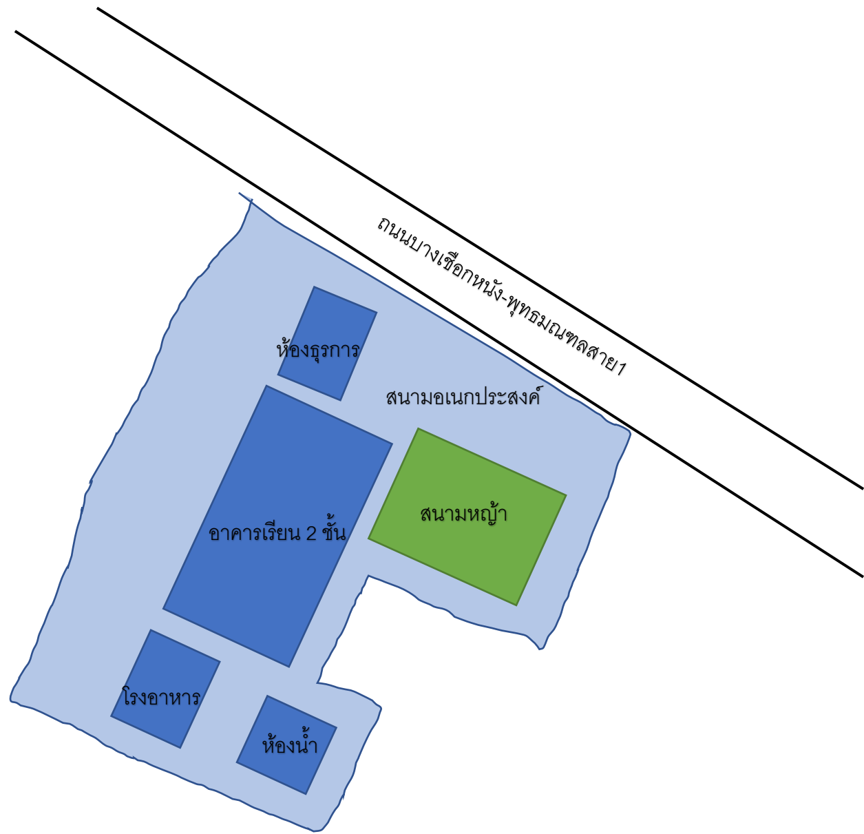
ผังอาคารเรียนและสถานที่ โรงเรียนอนุบาลนกอ้อย